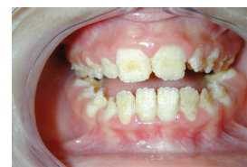
Exemples d'amélogénèse imparfaite

La dentinogénèse imparfaite (DI) est caractérisée par une malformation de la dentine (partie située sous l'émail et servant de matrice morphologique à la dent) qui présente un défaut de minéralisation. La DI peut être isolée ou associée à un autre syndrome comme par exemple l'ostéogénèse imparfaite (fragilité osseuse constitutionnelle). Le diagnostic précoce par le chirurgien-dentiste est essentiel pour la prise en charge thérapeutique et la limitation du risque de fractures osseuses.